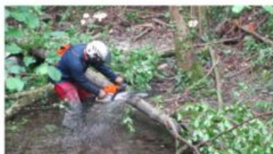
Travaux d'entretien de la rivière par l'équipe verte de l'EPTB Gardons : les végétaux susceptibles de faire obstacle à l'écoulement naturel du cours d'eau sont éliminés

passant par la Gardonnenque et les Gorges du Gardon qui accueillent le célèbre Pont du Gard. Il regroupe 161 communes (200 000 habitants) et compte plus de 3000 km de cours d'eau.