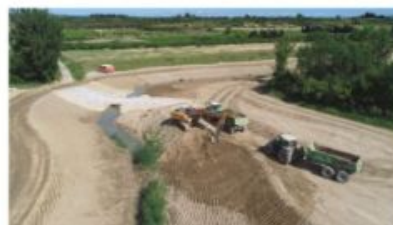
Travaux de suppression de digues défilantes et renaturation du Briançon à Théziers (ci-dessus) - Prélèvement réalisé dans le cadre d'une étude sur les eaux souterraines (ci-contre)