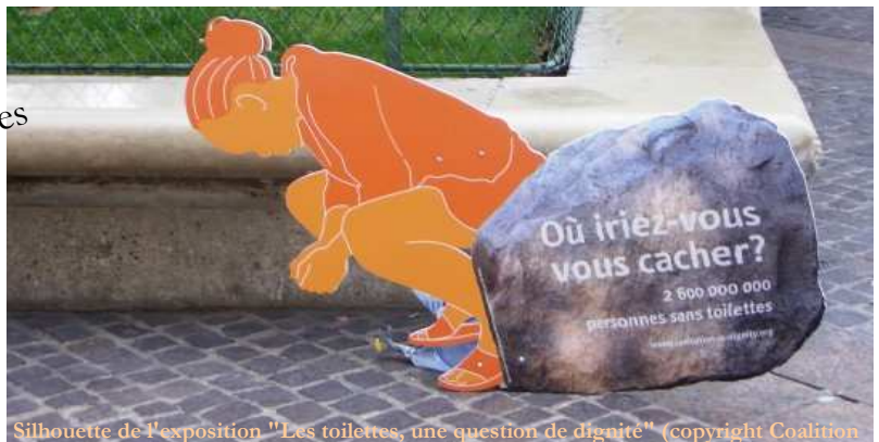
Silhouette de l'exposition "Les toilettes, une question de dignité"

L'eau & l'assainissement sont indissociables